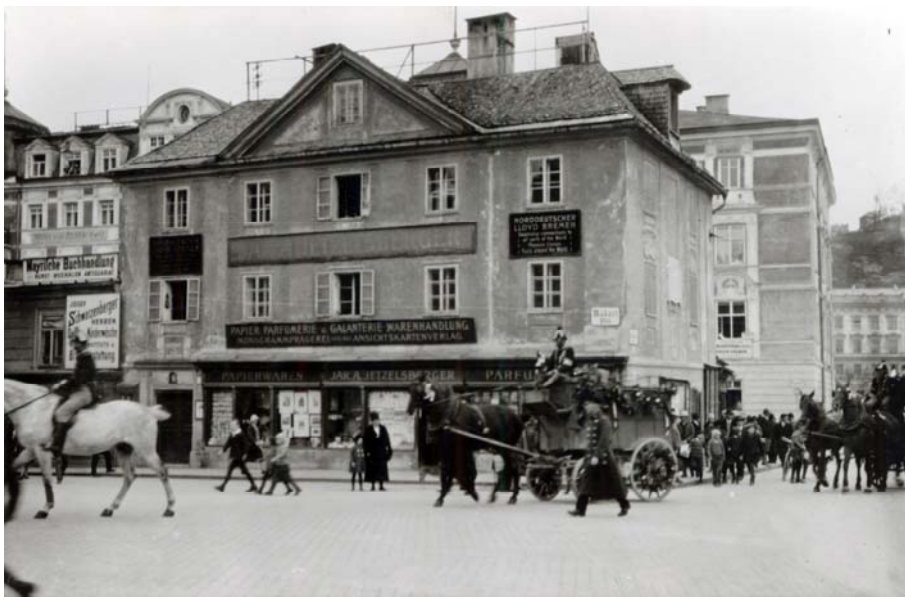
Die letzte Ausfahrt am 31. März 1928.

„Post“ versehen. Der Fassungsraum der Wägen, die von den Austro-Fiatwerken geliefert wurden, ist beiläufig doppelt so groß als der, der bisherigen Wagen. Neu in der kommenden Einteilung ist, dass Siesenheim nun direkt beliefert wird, während bisher daselbst nur eine Postablage bestand, die sich täglich die Postsachen mittels Landbriefträgers von Maxglan holen lassen musste. Die Postpferde waren bisher von der Firma Angelberger gestellt worden. Es liefen täglich zwölf Pferde, bedient von zehn Kutschern. Mit der Einführung der Automobilisierung hört also das bisherige offizielle „Poststallamt Angelberger“ zu bestehen auf. Aus Anlaß des letzten Postsammeldienstes mittels Fuhrwerkes wird der am 31. März 1928 um 4 Uhr nachmittags vom Hauptpostamt abgehende Sammelwagen mit den Postangestellten in alten Uniformen besetzt sein. Der Postillion wird wehmütige Abschiedslieder blasen. Auch die alten Wagen werden zur Feier ihren Teil beitragen, indem sie bekränzt werden. Der Wagen wird seinen Weg zum Makartpostamt, Wolf Dietrich-Straße, Bahnhof und zurück nehmen. Es wird ein trauriges Abschiednehmen sein und die Spatzen müssen sich ihren Leibriemen noch enger als bisher schnallen, wenn die Postgäule so zwecklos geworden sind, dass sie selbst ihnen nichts mehr abgeben können. Industrialisierung der Welt... .