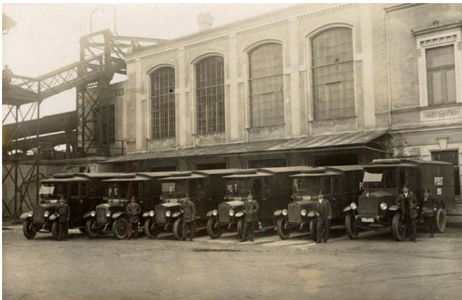
Die ersten Paketwagen in Salzburg 1928 (Fotos Sammlung B. Winkelhofer).